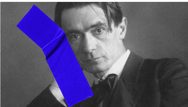
Zeit Online © [M] ZEIT ONLINE; Fine Art Images/Heritage Images/Getty Images