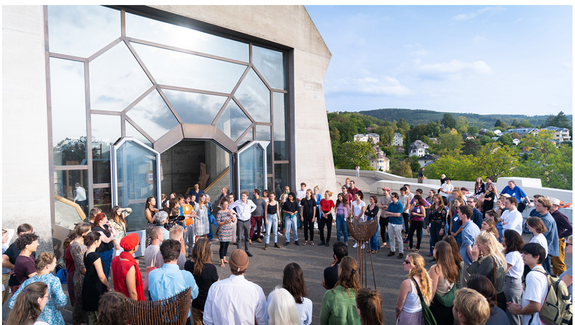
Goetheanum - Weltkonferenz 2023